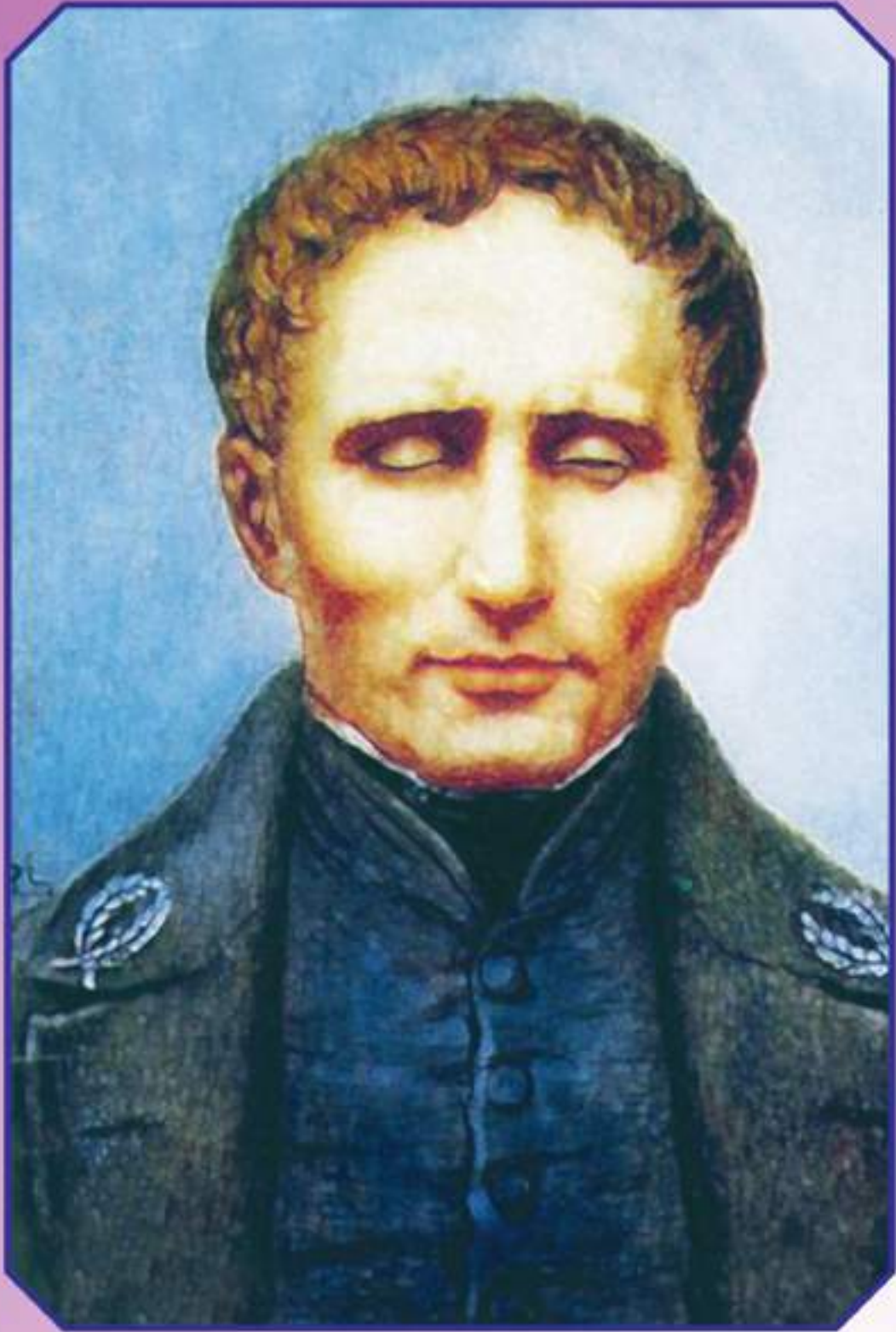
అంధుల అక్షర ప్రధాత లాయి జ్యేయిలి